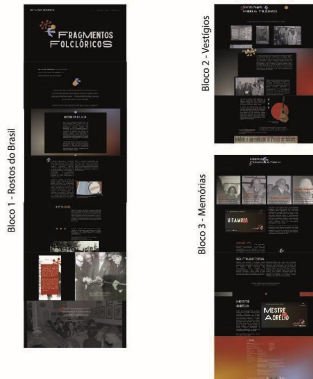
Figura 3 – Site “Fragmentos Folclóricos”, dividido em seus blocos (2024).