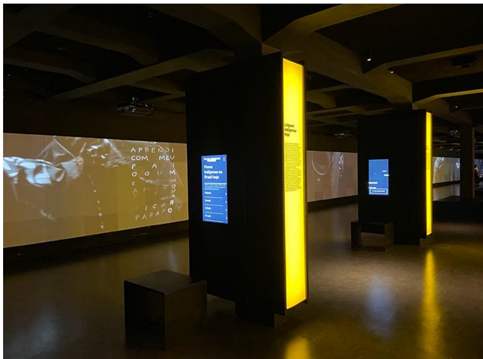
Figura 3 – Exposição interna com tecnologias digitais