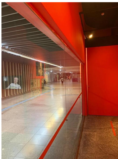
Figura 2 - Parte interna do MDS que pelo vidro mostra a estação República do Metrô