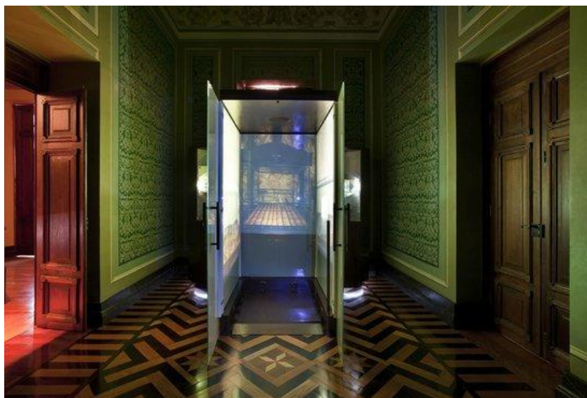
Figura 2 – Projeção da Mina de Morro Velho.