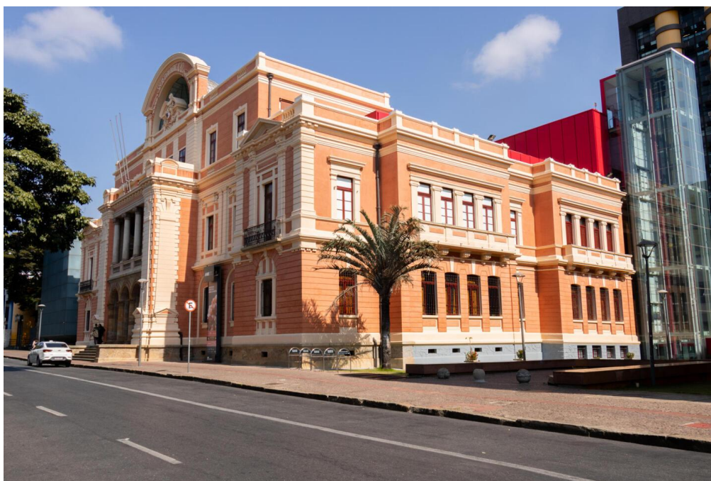
Figura 1 – Fachada do Prédio Rosa.

A exposição inicial, “Espaço do Aço”, apresenta de forma interativa a importância do aço, seu papel na economia circular e inovações. No primeiro andar, o público percorre a memória das minas de Minas Gerais e seus minerais principais, como ferro, ouro, manganês, entre outros.