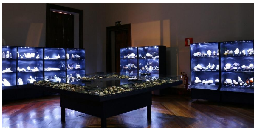
Figura 3 – Sala “Minerais do Brasil”.