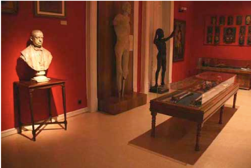
Figura 3 - Sala de Orígenes (Antropología Física) no MNA.

Numa breve descrição de seu acervo, os primeiros objetos encontrados ao entrar na sala são duas estátuas em tamanho natural descritas como “hombre y mujer hotentote”. Deste modo, o primeiro elemento visual que a Sala de Orígenes oferece é uma imagem que remete ao polêmico episódio da “Vênus Hotentote” 4 . Ao lado está uma vitrine de madeira e vidro dividida em duas partes e composta por três esqueletos montados de pé: do lado esquerdo estão duas espécies de orangotango e do lado direito um esqueleto humano, numa clara referência ao conhecido modo evolucionista de exibição de objetos (GONÇALVES, 2007; DIAS, 1994). Na seqüência, estão dispostas algumas estátuas: uma mulher branca com traços orientais, o busto em gesso do próprio Dr. Velasco, a estátua de pé de Agustín e uma estátua de um homem negro. Acima, na parede estão afixados os quadros com as pinturas dos retratos do fundador do museu e de sua filha, Concha González, e ao lado da última estátua está uma pintura legendada como “cópia del cuadro titulado El negro pío”. Este quadro teria sido encomendado por um dos diretores do MNA, D. Manuel Antón y Ferrándiz, retratando um homem negro que aparentemente sofria de vitiligo, sendo à